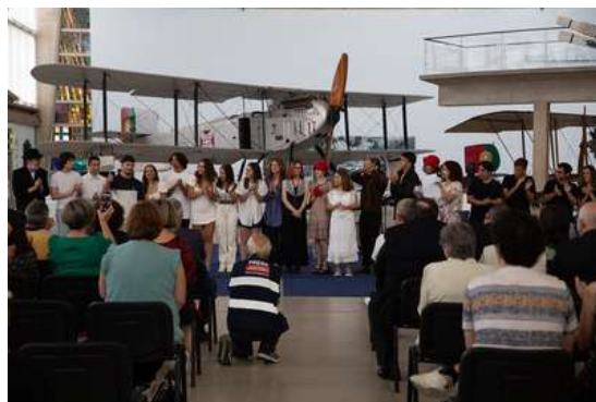
Elementos do Clube de Teatro da ESSA, durante os agradecimentos ao público presente

Com enfoque na figura de Sacadura Cabral – o homem e a sua epopeia – a peça foi revelando, ao longo do espetáculo, alguns factos menos conhecidos do grande público, deste herói nacional.