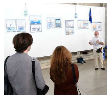
Fotografias de Manuel Ventura, Marinha do Tejo