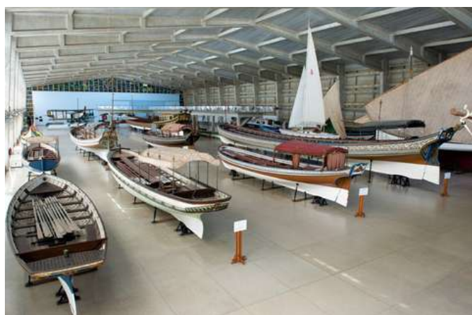
Pavilhão das Galeotas - Museu de Marinha

Vamos continuar a cumprir a missão de salvaguardar e divulgar a história marítima nacional, recorrendo à inovação tecnológica, apresentando o passado com os olhos no futuro.