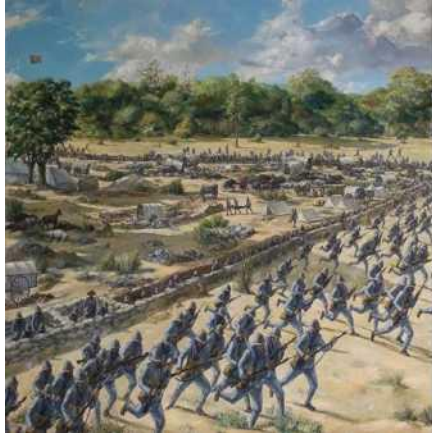
Pintura a óleo sobre tela: O Quadrado de Môngua"

Identifica a que batalha se refere a Figura.